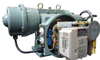
インバータ制御ユニット内蔵型