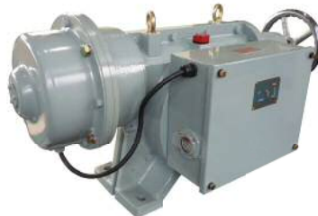
制御盤ユニット別置型