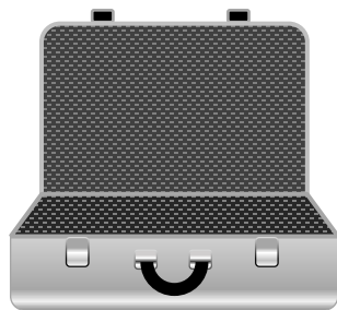
メンテナンスキット

お手数ですが、 お客様側 でレベル計との接続やパソコン・ポケットWifiの起動など セッティング を行って頂きます。