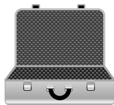
メンテナンスキット

終了後はメンテナンスキットをお取り外し頂き 弊社工場へご返却 をお願い致します。