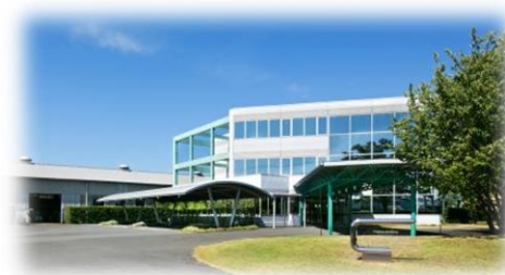
マツシマメジャテック 本社・工場