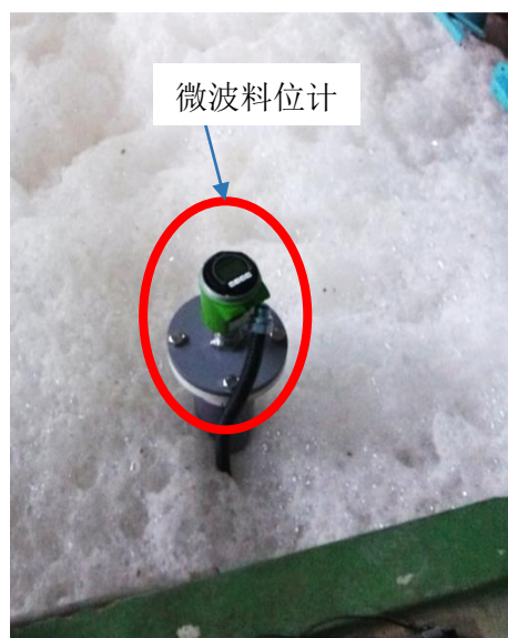
※图以及照片：导向管内无泡沫检出液面的样子